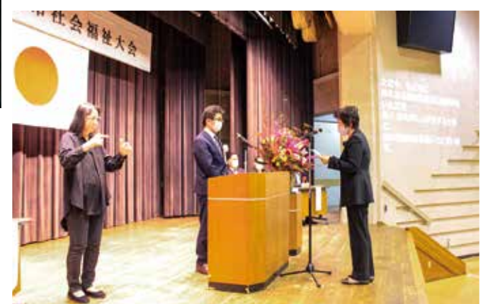
〔受賞者あいさつの様子〕