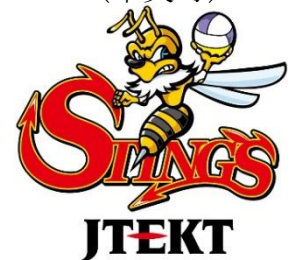
ジェイテクト STINGS のロゴ