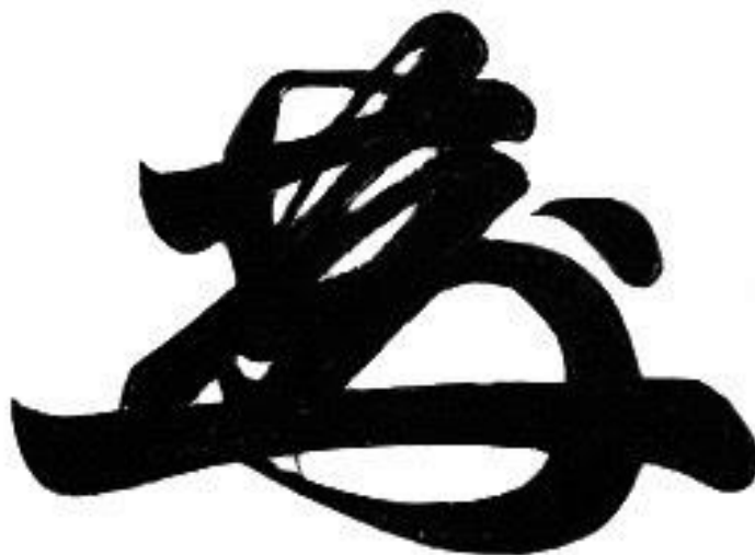
桑名藩主松平定敬花押