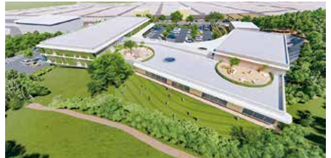
※本イメージは現段階のものであり、確定したものではありません。