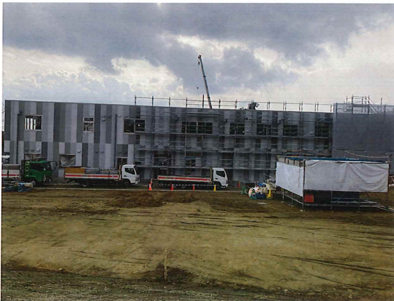
現場状況写真 かよいのエリア