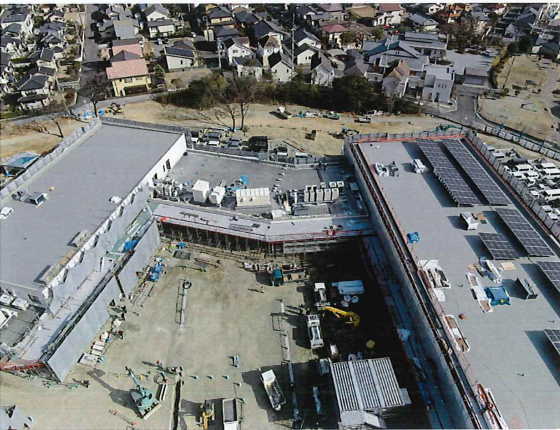
施工進捗状況 (ドローン空撮)