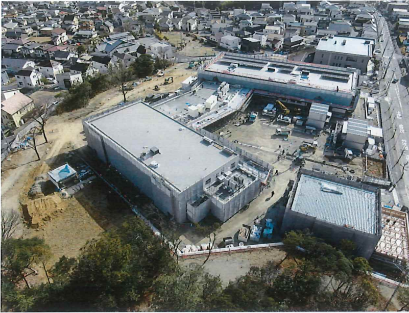
施工進捗状況 (ドローン空撮)