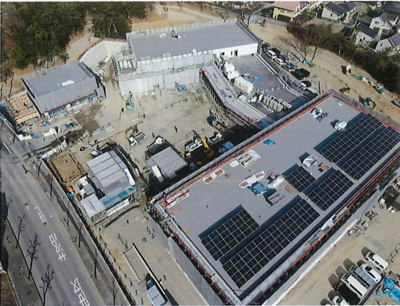
施工進捗状況 (ドローン空撮)