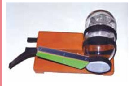
【瓶蓋オープナーセット】