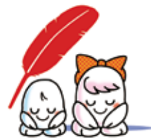
きぼうくん あいちゃん