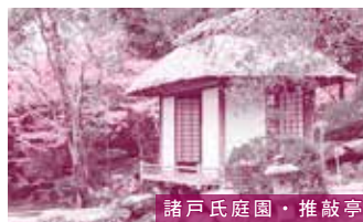
諸戸氏庭園・推敲亭

開催期間 11月6日(土)～12月5日(日) 時 間 六華苑 9:00～17:00(入苑は16:00まで) 諸戸氏庭園 10:00～17:00(入園は16:00まで) 料 金 一般750円