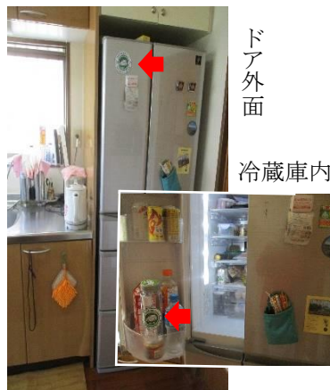
冷蔵庫へ収納状況