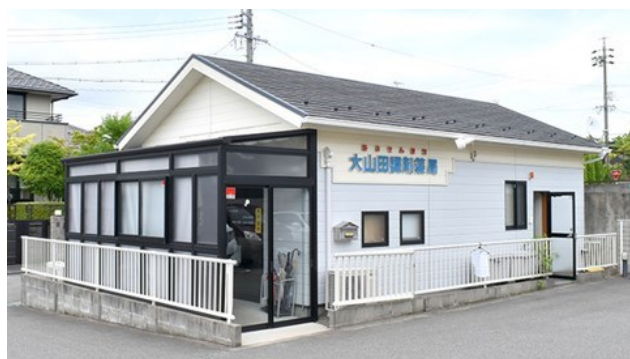
(かわはし大山田調剤薬局 様)