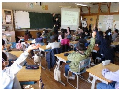
2月22日(水)→ 認知症キッズサポーター養成講座の様子