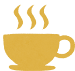
←2月15日(水) オレンジカフェの様子