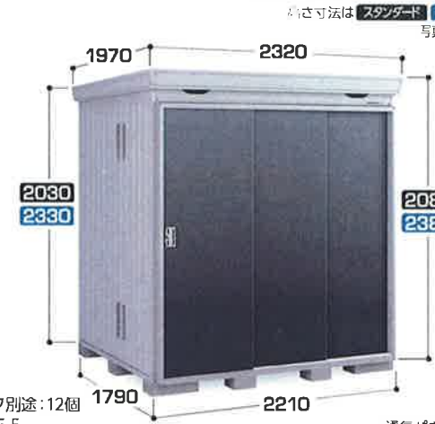
高さ寸法は スタンダード / ハイルーフ です。写真はFP-2218HT/CG