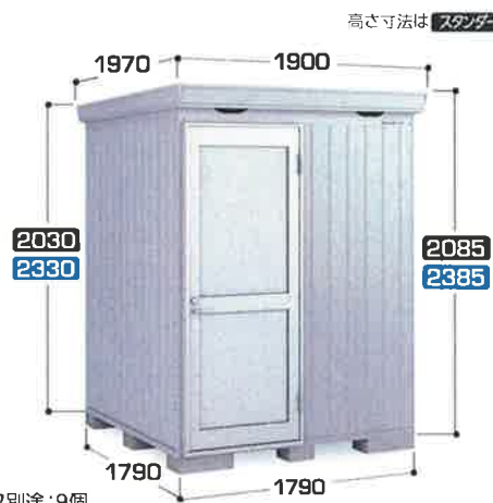
高さ寸法は スタンダード / ハイルーフ です。写真はFP-1818HD